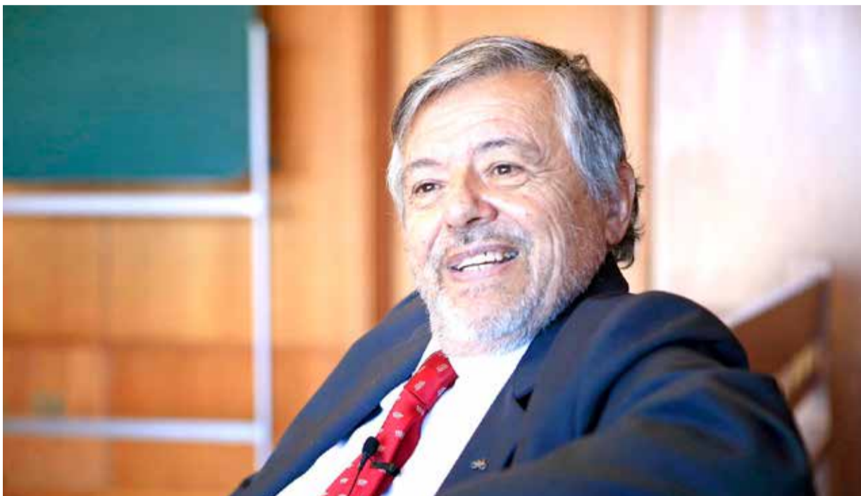
El ministro Rodrigo Biel, pone término a su carrera dentro del Poder Judicial.

“Es complicado esto de ser justo, porque la Justicia tiene muchas acepciones, como entregar a cada cual lo suyo, pero