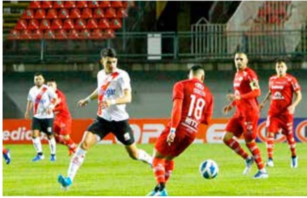
Esta tarde se juega a estadio lleno el siempre atractivo clásico entre curicanos y chillanejos.

Se juega hoy desde las 17:30 horas con pitazo de Rodrigo Carvajal. Ambos suman 48 unidades en la tabla y Curicó Unido tiene una más favorable diferencia de gol que los chillanejos: +19 tiene el Curi, mientras