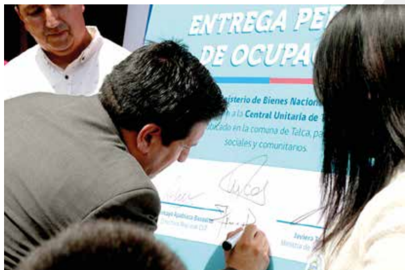
Después de 20 años, la CUT de Talca tiene una sede para atender a los trabajadores, esto gracias a un inmueble que fue cedido por Bienes Nacional.