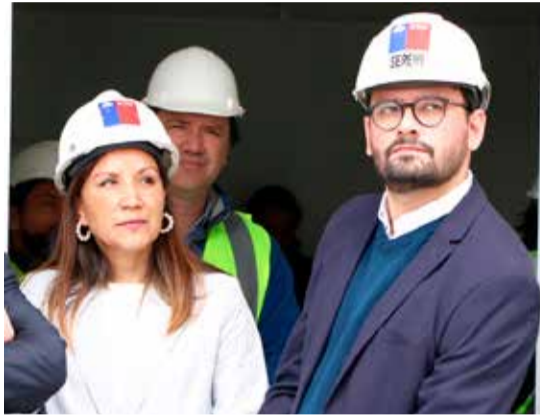
Las autoridades explicaron que el proyecto se basa en el Plan Maestro de Transporte, el Plan Regulador Comunal y busca disminuir los tiempos para acceder a la zona céntrica.

“Lo que estamos licitando es una consultoría de diseño del proyecto, lo que nos abre la posibilidad de