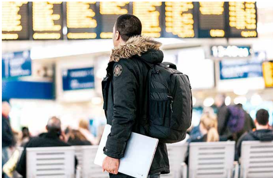
Quienes aprovechan estas oportunidades coinciden en sus múltiples beneficios

Cabe mencionar que la movilidad es solo una de las aristas que abarca la internacionalización en la UTalca, que también contempla el desarrollo de proyectos conjuntos, de docencia e investigación, entre otros ítems.