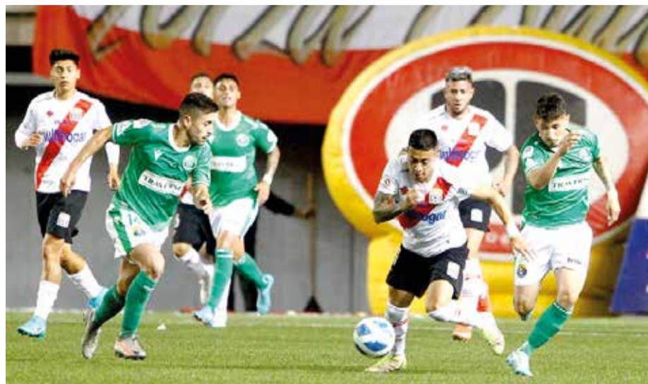
Gracias al empate con Audax Italiano, Curicó Unido recuperó el subliderato de la tabla del Campeonato de Primera A. El equipo tortero se enfrenta esta tarde con Ñublense en el último partido de la temporada en La Granja.