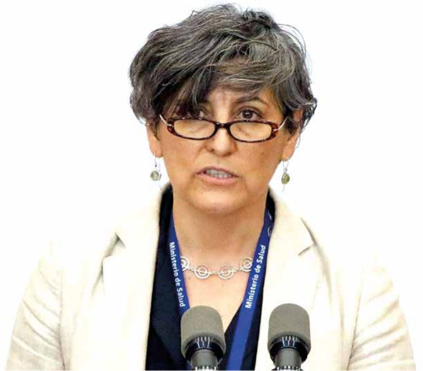
Ximena Aguilera, ministra de Salud se refirió al aumento de casos Covid.

Ximena Aguilera. “Yo creo que como ciudadanos hay que estar pendientes de esta situación, nosotros hemos aclarado que la pandemia no ha terminado”, sostuvo la autoridad.