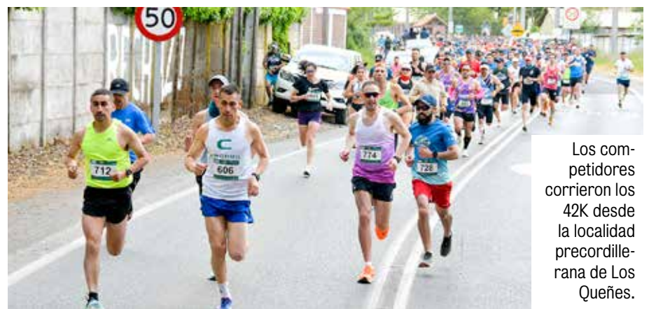
Los competidores corrieron los 42K desde la localidad precordillerana de Los Queñes.