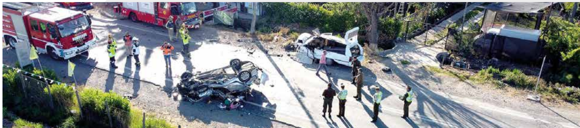
Una colisión frontal dejó como saldo a tres personas fallecidas. El hecho se produjo en la peligrosa ruta K-16 en la comuna de Sagrada Familia.