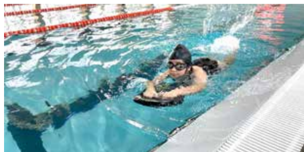
Una vez finalizada dicha actividad, todo lo que se recaude será donado a la Teletón.

TALCA/CURICÓ. Más de 100 personas ya se han inscrito a fin de participar en la denominada "Natatón", actividad organizada por el Club Social y Deportivo Tiburones de Curicó, que cuenta con el apoyo del Mindep-IND. La idea es reunir fondos, los que en su totalidad serán donados a la Teletón. Para ello, el desafío es poder completar 24 horas de natación de manera ininterrumpida, en la piscina temperada del estadio Bicentenario Fiscal de Talca (la cual detenta ocho carriles), teniendo como punto de inicio el viernes 4 de noviembre a las 18:00 horas (las puertas del recinto se abrirán una hora antes). Los organizadores recalcaron que no se trata de una competencia, sino que, de un desafío de carácter