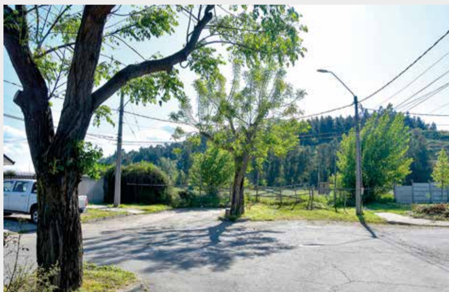
Polémica ha causado en Curicó el posible trazado que tendría el proyecto vial que busca conectar el sector de Zapallar con el centro de la ciudad, debido a que parte del tramo sería por el costado del cerro Condell, donde existen humedales urbanos.