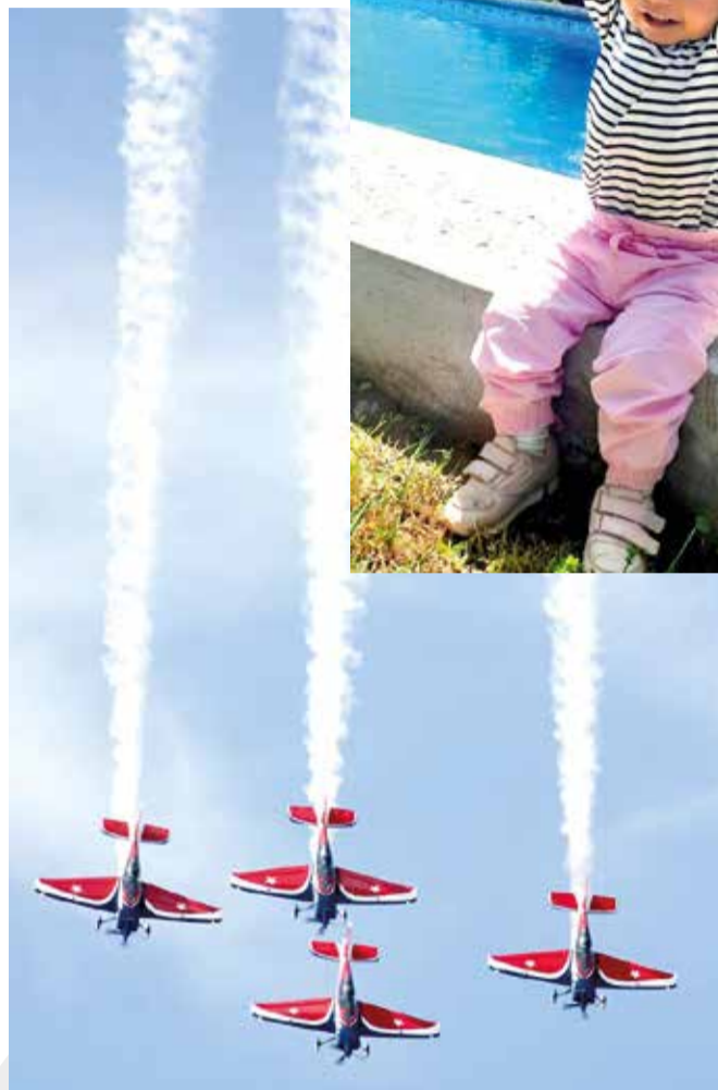
Una espectacular presentación realizaron los Halcones de la FACH en Curicó, en el marco del Festival Aéreo que organizó el Club Aéreo de la ciudad.