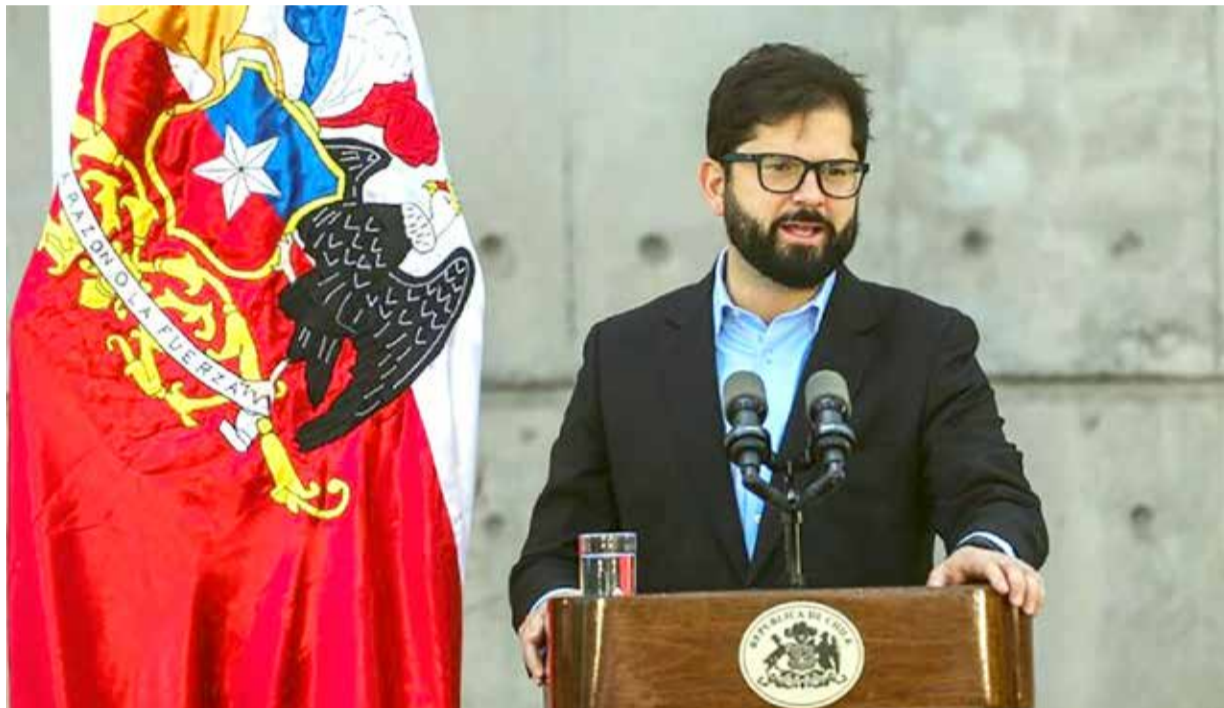
La desaprobación del Presidente Boric llegó al 63,4%.

acuerdo con una nueva Constitución, mientras que un 26,9 señaló estar muy en desacuerdo con la