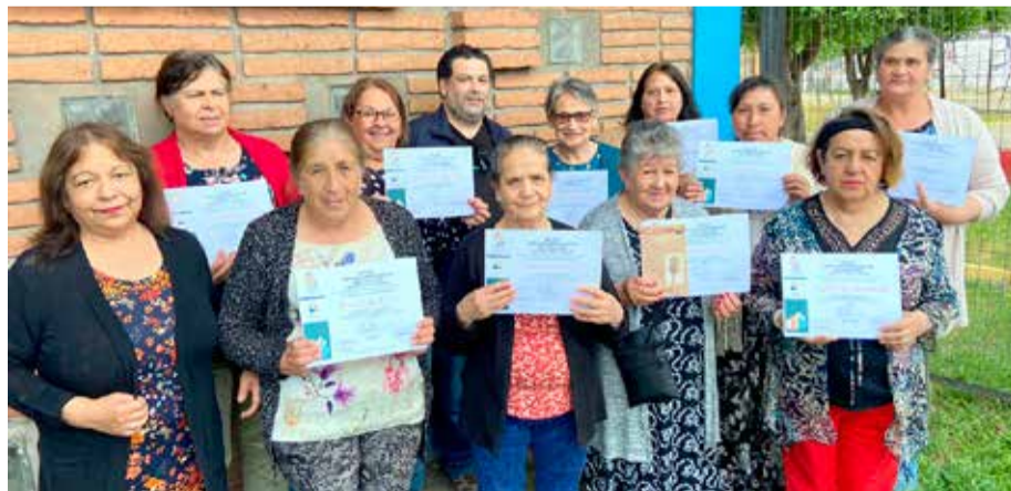
Las participantes recibieron su respectivo diploma.